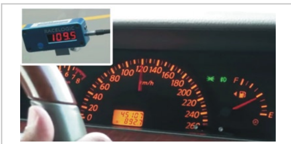
▲ 圖1. 速率計實測結果顯示

當然，造成以上情況經常在出現的最大因素通常是源自於每位駕駛者的開車習慣及是否遵守交通規則的道德問題，但是也有少部分的原因，是因為車輛『速率計』（通稱為時速錶）顯示結果，造成駕駛者誤會，連帶影響了行車速率。簡單來說，就是車輛的時速錶會與真實車速有些許誤差，而此誤差在無形當中就讓駕駛者的認知上吸收到錯誤的訊息(如圖1所示)。