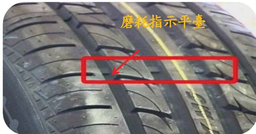
圖 3 輪胎磨耗指示平臺

輪胎胎面提供抓地力、摩擦力和牽引力，以防止車輛打滑和失控，為了安全起見，應養成定期檢視汽車輪胎胎紋深度。輪胎的兩側胎邊靠近胎面處有「△磨耗指示點」，延伸至輪胎胎面正中間凹槽內，有 3 個以上警示凸出點(稱磨耗指示平臺，如圖 3)，當輪胎胎紋被磨至該指示點時，表示胎紋深度不足(如圖 4)，須趕快換輪胎，否則很容易發生爆胎。另交通部已將車輛所使用輪胎之胎紋深度不足 1.6 公厘納入牌照及定期檢驗的項目之一。