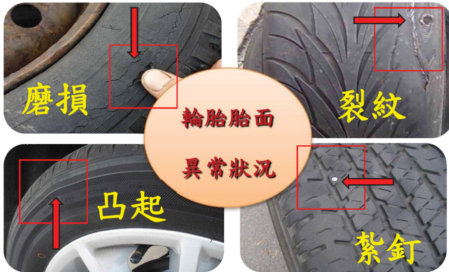
圖 5 輪胎胎面異常狀況(不規則磨損、裂紋、凸起、紮釘)

應隨時檢查輪胎狀況，如發現輪胎有損壞跡象，如不規則磨損、裂紋，凸起及紮釘等(如圖 5)，應即更換輪胎或找專業技師鑑定。