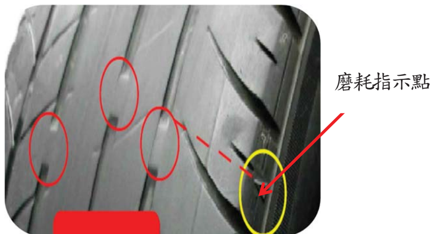
圖 4 輪胎溝紋已磨耗至指示平臺(須更換新胎)