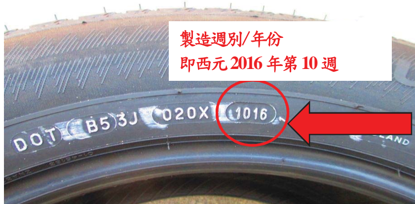
圖 2 製造日期代碼之標示圖例