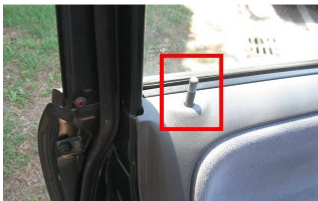
圖 2 容易因內部彈簧鬆弛而鎖住的門鎖

依據兒童及少年福利法第 32 條，6 歲以下或有需要特別看護的兒童，不可讓他獨處或由不適當的人代為照顧，違反規定的父母親或照顧者，可依兒童及少年福利法第 60 條，處罰 3000 元以上 15000 元以下罰鍰；依 65 條需接受 8 小時以上 50 小時以下親職教育輔導。(兒童及少年福利全文內容請連結至