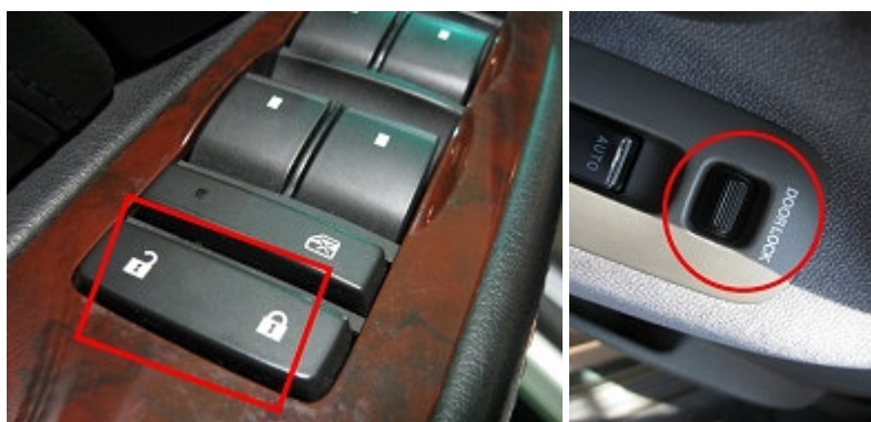
圖 1 車門鎖

鑰匙掉了！怎麼辦？撿起來就好啦！但..萬一是掉在撿不到的地方，甚至是反鎖在車內呢？在炎炎夏日中的車友們，如果路上看見想購買的東西，想說臨時停車一下就好，而未將車輛熄火取出鑰匙，此時，若發生因車主操作不當鎖住車門或誤將車內防盜鎖啓動(圖 1)，甚至因門鎖內部彈簧鬆弛(圖 2)，大力關閉車門時產生的震動，造成門栓掉落而鎖住車門，這些都是有可能發生的，更糟是萬一車內還有幼童被困住，就很快會上新聞版面了，可別以為只是個簡單車輛故障事件喔，這可是違法違規的事！萬一造成幼童傷亡，那可就嚴重了，奉勸車友們別貪圖一時的便利，因為您真的不知下一秒會發生什麼樣的狀況。