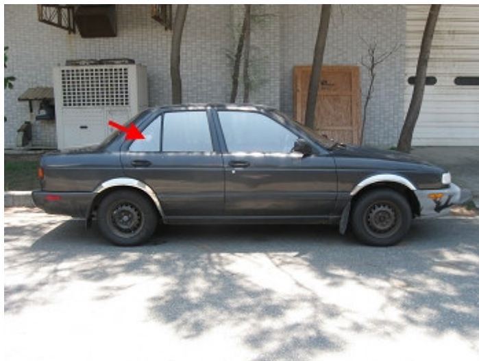
圖 7 一般易於破壞或更換且較易解鎖的玻璃窗

三、破窗而入：情況緊急或身處荒山野嶺，確認鑰匙反鎖於車內，無人前來支援時，挑選一塊易於破壞或更換且較易解鎖的玻璃窗，破窗而入！通常建議挑選後座的窗戶(圖 7)，打破即可開啓後座門把，請小心別被玻璃割到手，當然也有貼心的車廠，只要撬開同樣位置的塑膠飾板，即可伸手入車內開啓，平時可事先詢問原廠維修保養人員，自己的愛車破壞哪一片玻璃較為合適。