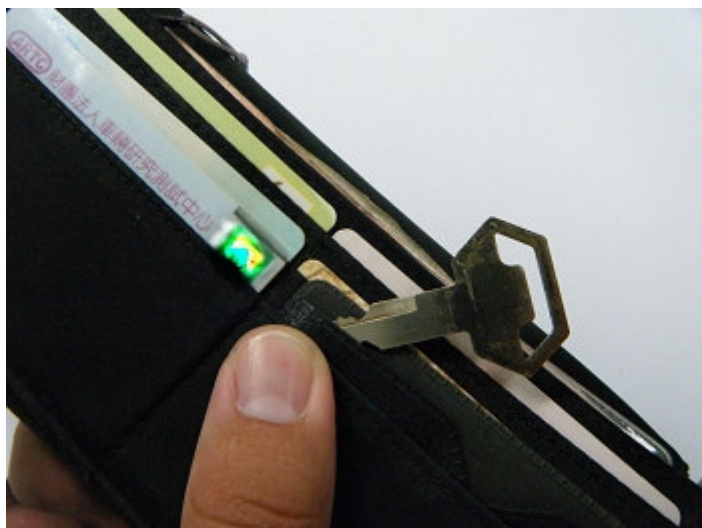
圖 5 鑰匙隨身備份

二、求救達人：求救於道路救援、請鎖匠、原廠維修人員、車廠維修員、甚至是警消人員，但必須備好行照、駕照、身份證驗明正身，其實國內擁有一些知名的解鎖高手，不小心反鎖時，上網收尋一下即可，若是特殊高級車款(圖 6)，建議聯繫原廠處理，避免破壞原廠設計。