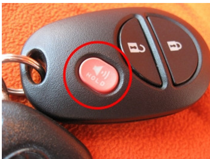
圖 3 尋車功能

市面上鑰匙千百種，隨著科技進步，鑰匙的功能也越多，在享受科技帶來便利性的同時，多少也得承擔其帶來的潛在危機。過去若發生車鑰匙掉落在某處，並不會特別擔心陌生人撿走，有可能造成愛車失竊，而現今不少車鑰匙都具有尋車的功能(圖 3)，輕輕一按，愛車就閃著警示燈、喇叭..告訴您「車子在這裡！」；因此，萬一遺失的鑰匙落入有心人士的手裡，運用這些便利的功能竊走您的愛車，後果可就不堪設想了。高科技帶來便利的生活，隨著車輛科技的進步，卻也衍生出更多的防盜機制，但往往也造成使用者(車主)的不便，每次都要開啓層層的鎖，比如方向盤鎖、排檔鎖..才能開車上路；這些「鎖」也隨著時間，不斷一代、二代商品產出，鎖是越來越多，而偷兒卻往往能在幾分幾秒內就開走您的愛車，甚至偷兒直接來個石頭破窗的技倆取走車輛。但也是有夜不閉戶的先進國家，比如部分的重型機車，出廠就沒設置「鎖」的功能，在這些國家上不上鎖似乎是無妨的。