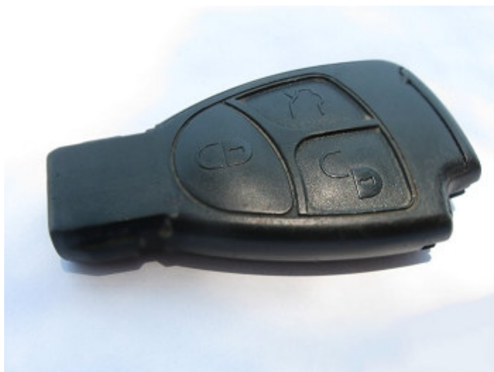
圖 4 晶片式鑰匙